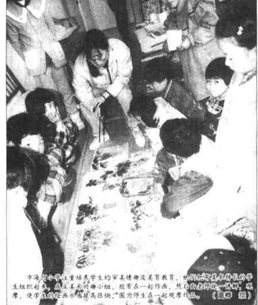
市海韵小学注重培养学生的审美情趣及美育教育，他们组织了学生组织起来，成立美术兴趣小组，经常在一起作画，热烈的气氛，使他们画的画水平不断提高。因为师生在一起观摩作品。(张福刚)