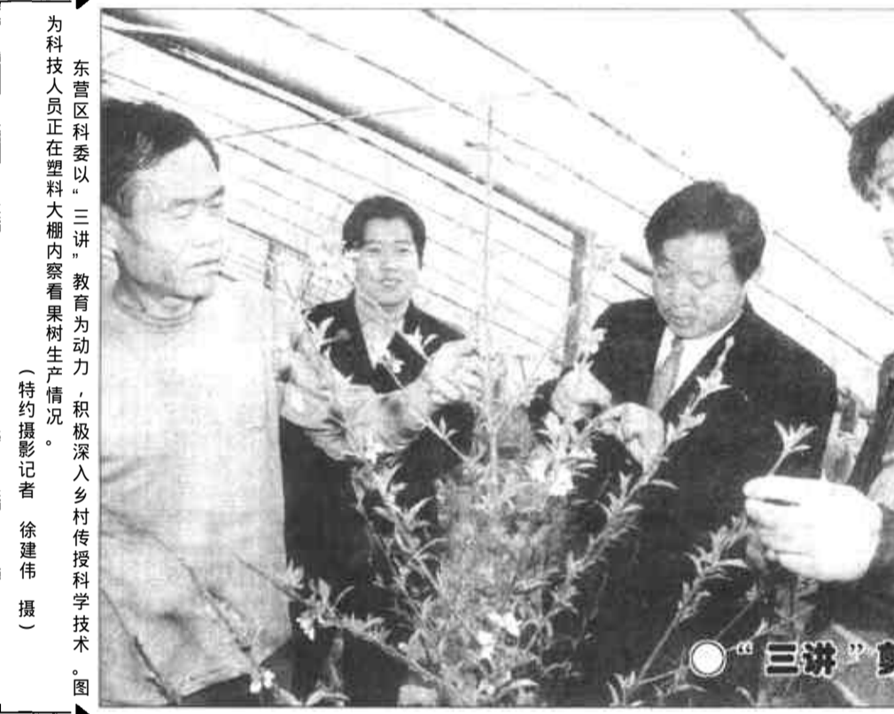
为科技人员正在塑料大棚内察看果树生产情况。

本报讯 河口区城郊西南侧曾是一片白茫茫的盐碱荒地。如今,这里却是另一番景象:一个具有相当规模的占地1058亩的“农牧渔综合开发示范区”已经建成;更让人意想不到的是:偌大的一个园区,竟全部由正式离岗的126名区直机关干部领办经营。 河口区委、区政府从一些乡镇干部中选拔出一批能力强、肯吃苦、爱创业的干部,鼓励他们走出机关,投身到农村,发挥他们的聪明才智,为农村经济的发展和农民增收做出更大的贡献。 一部分人担心离岗后身不由己,断了“退路”,丢了“饭碗”。针对这些问题,区委、区政府一方面大胆决策,发动区直23个单位共同筹资建设一处示范区;另一方面他们及时出台一系列鼓励政策,如凡到园区工作的机关干部,保留编制、工资、保险、公积金不变,并优先评聘职称,优先提拔重用。一系列举措的出台和实施,打消了机关干部们的后顾之忧,他们纷纷主动申请到园区一线当“信”,为园区的发展贡献智慧和力量。